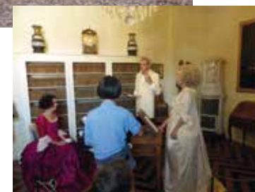
Vente à l'allumette : un succès de fréquentation.