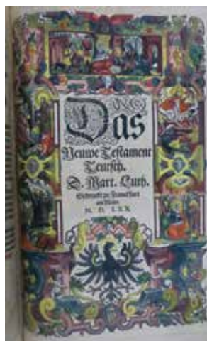
Frontispice du Nouveau Testament.