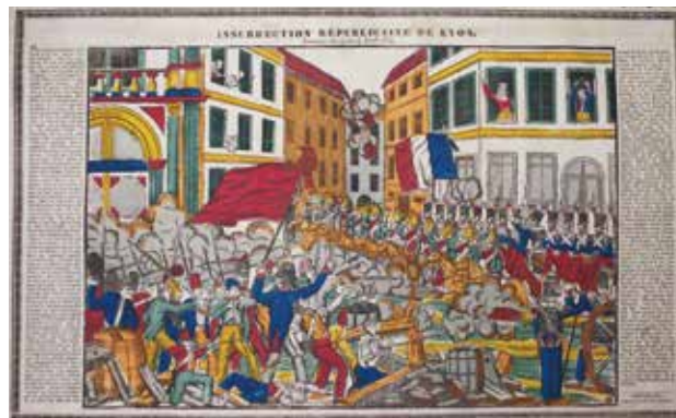
Insurrection républicaine de Lyon (9-14 avril 1834). © A. Bouvard

Lors des journées du patrimoine, la Société d'émulation remettra au musée 23 images Deckherr acquises à l'époque de la présidence de Jean-Marc Debard. Elles compléteront la riche collection (une centaine d'images) conservée par le Musée, à l'initiative de la SEM.