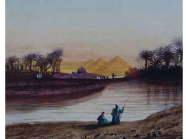
Le Nil et les pyramides de Guizeh, Paul Beurnier.